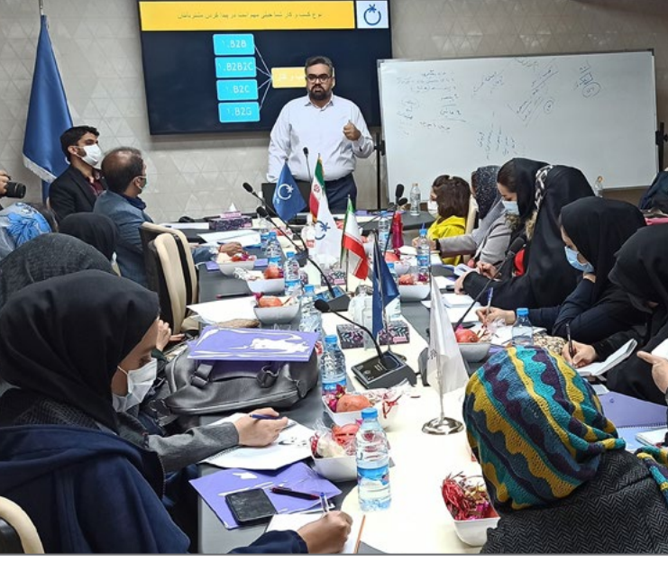
بازار اجتماعی نخل در حال برگزاری کارگاه آموزشی است.