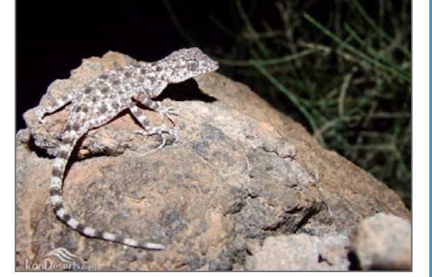
جکوی انگشت دراز نیکولسکی

پراکنندگی جهانی: ایران، افغانستان، ترکمنستان، ازبکستان؛ اندازه: نوک بوزه تا مخرج ۶۱ میلی متر ۷۵ میلی متر.