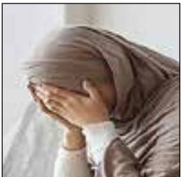
مدیرکل مشاوره و امور روانشناستی

سازمان بهداشتی کشور از پاسخ به بیش از ۳ میلیون و ۱۸۹ هزار تماس با خط مشاوره تلفنی ۱۴۸۰ از ابتدای شیوع ویروس کرونا تا اول دی ماه سال جاری خبر داد و گفت: از این تعداد ۶۹ هزار و ۵۶۰ تماس مربوط به مسائل کرونا و ۳۳۲۲ تماس مربوط به کادر درمان در تهران بوده است.