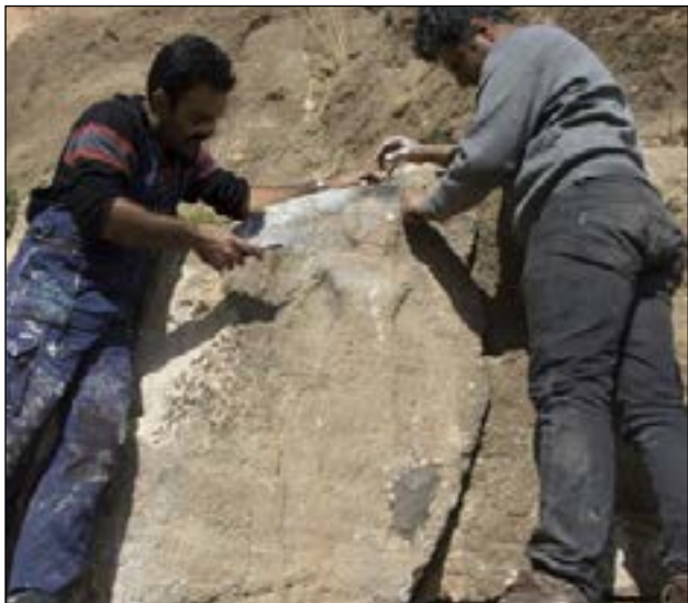
این کارشناس مرمت اضافه کرد: درمرمت گنبد مسجد «شیخ‌لطف‌الله» نمونه درخوردن نامی است، چنین رفتاری با این مسجد بی‌نظیر، پرسش‌برانگیز بود، از این جهت که کار به کجا رسیده که گنبد یکتا و منحصر به فرد مسجد شیخ‌لطف‌الله - که در فهرست میراث جهانی هم قرار دارد - عرصه از سون و خطا شود؟ به نظر من یکی از عوامل چنین اتفاقی ناگواری، نبود شناخت کافی از ارزش‌های میراث فرهنگی است. این ناآشنایی در سطوح گوناگون دیده می‌شود، والا مگر می‌شود ما بدانییم که مسجد «شیخ‌لطف‌الله» چه گوهر یکدانه و بی‌همتایی است و به آن شکل کاشی‌های گنبدش را مرمت کنیم، واضح است که یک جای کار می‌لنگد. البته دست‌اندرکاران مرمت قصدشان حفاظت و نگهداشتن این آثار است. اما احتمالاً لوازم این کار فراهم نیست. منظورم از لوازم کار، شناخت و درک ارزش‌های آثار و بناهای تاریخی، فنون و مهارت‌های کافی، تعهد، علاقه و صد البته اخلاق حرفه‌ای و مواردی از این دست است. به هر حال، مرمت گنبد «شیخ‌لطف‌الله» زنگ خطر بود، از این باب که وزارت میراث فرهنگی نسبت به نتیجه کار، اطلاع و اطمینان کافی حاصل نکرده بود. از همین رو، نتیجه کار همه را درآورد.

یک کارشناس مرمت درباره مرمت‌های تریست‌پسند در شهرهای مثل ماسوله و یزد که خطر تخلیه ساکنان اصلی از بافت تاریخی آن‌ها را در پی دارد، هشدار داد و وضعیت حفاظت و مرمت برخی آثار تاریخی را که در فهرست انتظار یونسکو برای ثبت جهانی هستند «رقت‌بار» توصیف کرد.