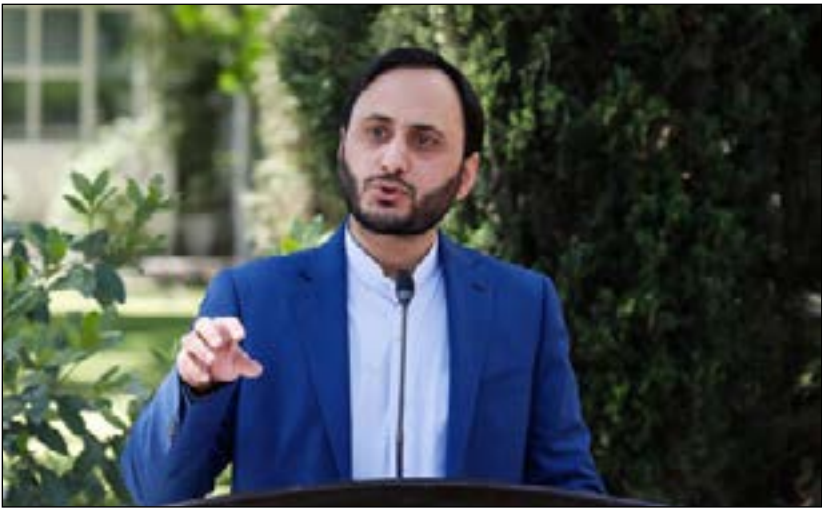
عکس منتشرشده از این

معاون اول رئیس جمهور دولت سیزدهم درباره نظارت بر بازار گفت: تاکنون پنج گروه کالا را قیمت زده‌ایم که تا هفته دیگر اجرایی می‌شود. چهار تا از آنها اساسی هستند.