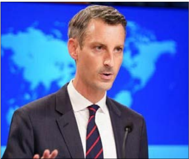
عکس منتشرشده از این

به این دارد یا نه، گفت: ما و متحدان اروپایی‌مان با صراحت گفته‌ایم که آماده نهایی‌کردن و اجرایی‌کردن فوری توافق مذاکره شده در وین برای بازگشتی دوجانبه به اجرای برجام هستیم اما این در نهایت به ایران بستگی دارد که تصمیم بگیرد از درخواست‌های فرا برجامی صرف‌نظر کند و با حسن نیت همکاری کند. این تصمیمی است که فقط تهران می‌تواند بگیرد.