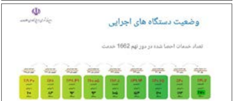
نقد خدمات احصا شده در دور نهم ۱۳۹۵ خدمت