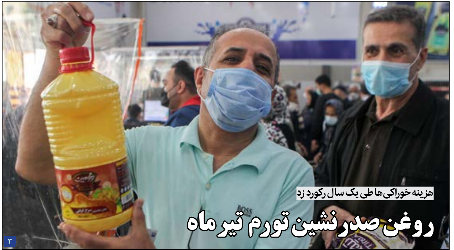
هزینه خوراکی‌ها طی یک سال رکورد زد

سامانه «مانسون» که از اقیانوس هند منشأ می‌گیرد، هر سال بخش‌هایی از جنوب و جنوب غرب کرمان را درگیر می‌کند