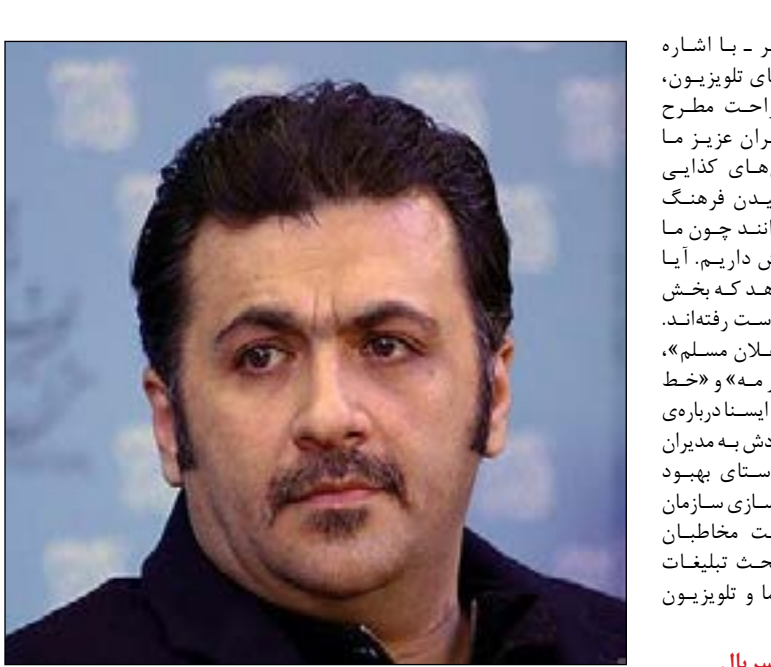
عکس شخصی ابعدی

کالاها را خریداری کنند، دینی به گردن ماست و به نظرم اتفاق درستی نیست. عبدلی سپس به بی‌علاقگی بسیاری از بازیگران به امر تبلیغات و پذیرفتن از سر اجبار به خاطر امرار معاش اشاره کرد و گفت: متأسفانه به دلیل اینکه اوضاع مالی و کاری خوب نیست، به هر کسی که پیشنهاد تبلیغات خبلی از سریال‌ها ایستد و مجبور است قبول کند تا بخشی از زندگی‌اش را از طریق همین تبلیغات بگذراند.