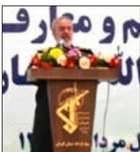
اسلامی، به عنوان معاون هماهنگ کننده سازمان بسیج مستضعفین معرفی و سردار محمدعلی نظری به عنوان فرمانده جدید سپاه ثارالله استان کرمان منصوب شد.

با حضور سردار علی فدوی جانشین فرماندهی کل سپاه پاسداران انقلاب اسلامی، سردار نظری به عنوان فرمانده جدید سپاه ثارالله استان کرمان معرفی شد. به گزارش خیرگزاری تسنیم، آیین تکریم و معارفه سردار حسین معرفتی فرمانده سابق سپاه ثارالله استان کرمان و معارفه سردار محمد علی نظری فرمانده جدید سپاه ثارالله استان کرمان عصر شنبه ۱ مرداد با حضور سردار علی فدوی جانشین فرماندهی کل سپاه پاسداران انقلاب اسلامی فرمانده جدید سپاه ثارالله استان کرمان در مصلى بزرگ امام علی علیه