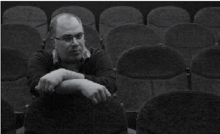
عکس شخصی زنگنه

نزداند، درباره مسائل تخصصی کار مانند مسائل فنی نگارش متن یا تکنیک‌های اجرایی نظر کارشناسی می‌دهند و حال آنکه این اشخاص تخصص لازم را ندارند و قرار است کارها را از دیدگاه مسائل آرزوشی و خفقرمزها، بررسی کنند. تجربه بعضی از ماهبه اندازه سن این دوستان است و توقع می‌رود به تجربیاتی که در این همه سال از سر گذرانده‌ایم، احترام بگذارند، اتفاقی که قبلاً در شورای نظارت رخ می‌داد چرا که بسیاری از اعضای آن از جامعه تئاتر بودند و نسبت به فعالان این رشته شناخت داشتند و حرمت تجربیات آنان را می‌دانستند. او اضافه می‌کند: این شیوه سبب شده اضطراب بیشتری به گروه‌های نمایشی تحمیل شود و قطعاً شرایط در آینده سخت‌تر هم خواهد شد و این در حالی است که کار تئاتر به‌ویژه در وضعیت فعلی، بسیار سخت‌تر از پیش شده و اتفاقاتی از این دست، سختی‌های بیشتری را هم ایجاد می‌کند. این اندازه