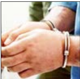
دستگیری ۱۰ نفر

فرمانده انتظامی شهرستان سیرجان از اجرای طرح مقابله با اراذل و اوباش خبر داد و گفت: با اجرای این طرح تعداد ۱۰ نفر اراذل و اوباش دستگیر شدند.