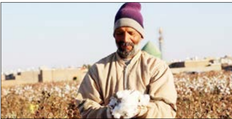
خبر جمهوری الای

طی سال ۱۴۰۰ فقط ۶ درصد از تسهیلات پرداختی بانک‌ها برای بخش کشاورزی بوده است که بیش از ۵۱ درصد تسهیلات بخش کشاورزی را تنها بانک کشاورزی پرداخت کرده و اگر تسهیلات بانک‌های ملت و تجارت را نیز به این رقم اضافه کنیم، حدود ۷۹ درصد از تسهیلات بخش کشاورزی را تنها این ۳ بانک پرداختند.