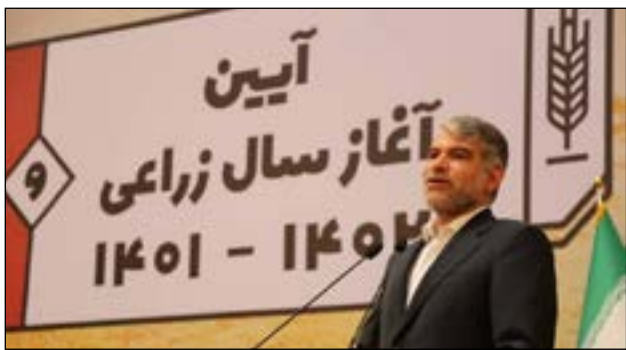
کلاس درس در یکی از پردیس‌های خودگردان

وزیر جهاد کشاورزی، گفت: از سر فصل‌های جدید در سال زراعی آن است که با ارائه مشوق‌هایی، مصرف آب کشاورزی در کشور به صورت پلکانی کاهش یابد و کشاورزان با کاهش مصرف هزینه آب‌بهای آنان کاهش می‌یابد. به گزارش خبرنگار اقتصادی خبرگزاری تسنیم، سید جواد ساداتی‌نژاد وزیر جهاد کشاورزی در مراسم آغاز سال زراعی ۱۴۰۱-۱۴۰۲ که با حضور رئیس‌جمهور و معاونین و روسای وزارت جهاد کشاورزی و کشاورزان نمونه در سالن اجلاس سران برگزار شد اظهار داشت: امیدواریم سال جدید زراعی را با کوردهای بهتر در تولید کشاورزی و تأمین امنیت غذایی داشته باشیم. وی خطاب به رئیس‌جمهور افزود: همانطور که شمار بازدید از وزارت جهاد کشاورزی شعار تأمین غذای با کیفیت، ارزان و پامشانه داخلی را اعلام کردید ما نیز در ادامه نواذ ادامه داد: در سال گذشته وزیر جهاد کشاورزی ادامه داد: بخشودگی و کاهش هزینه آب‌بهای کشاورزان در سال جدید بر اساس مصرف کشاورزان در دستور کار قرار دارد. ساداتی‌نژاد ادامه داد: در سال گذشته برای اولین بار قیمت خرید تضمینی محصولات کشاورزی قبل از آغاز فصل برداشت اعلام شد و در شرایطی که با جنگ اوکراین مواجه بودیم، قیمت خرید تضمینی محصولات کشاورزی ۱۱ هزار و ۵۰۰ تومان اعلام شد و زمینه تولید ۱۱ میلیون تن گندم در کشور فراهم کرد. همچنین در تولید محصولات آسلی دیگری از جمله جو و غله افزایش تولید داشتیم. وی تصریح کرد: کشاورزی قراردادی در سال جدید به صورت گسترده آغاز می‌شود و این