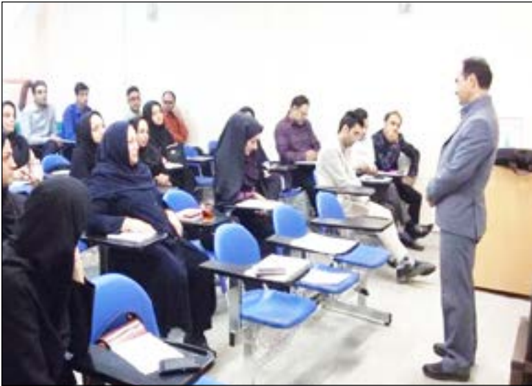
کلاس درس در یکی از پردیس‌های خودگردان