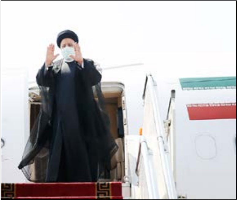
رئیس‌جمهور ایران در جریان سفر به ازبکستان

عطف برای گسترش ارتباطات منطقه‌ای ایران -اجرائی کردن سیاست خارجی دولت در زمینه دیپلماسی اقتصادی و سیاست همسایگی -از سرگیری روابط راهبردی و همکاری‌های دو جانبه بین تهران و دوشنبه و سفر رئیس‌جمهوری تاجیکستان به ایران در خرداد ماه امسال و امضا چند سند همکاری در حوزه‌های اقتصادی، علمی، سیاسی و فرهنگی. به گزارش ایرنا، سازمان همکاری شانگهای در ۱۵ ژوئن ۲۰۰۱ (۲۵ خرداد ۱۳۸۰) در شانگهای توسط قزاقستان، چین، قرقیزستان، روسیه، تاجیکستان و ازبکستان تأسیس شد و هند، قزاقستان، چین، قرقیزستان، پاکستان، فدراسیون روسیه، تاجیکستان و ازبکستان هشت کشور این سازمان اقتصادی منطقه‌ای شانگهای هستند. افغانستان، بلاروس، جمهوری اسلامی ایران و مغولستان هم در سازمان همکاری شانگهای دارای وضعیت ناظر و ۶ کشور جمهوری آذربایجان، ارمنستان، یاداشن، کامبوج، جمهوری چین، دموکراتیک فدرال نیپال، ترکیه و سریلانکا شرکای گفت‌وگویی این سازمان همکاری شانگهای به شمار می‌روند.