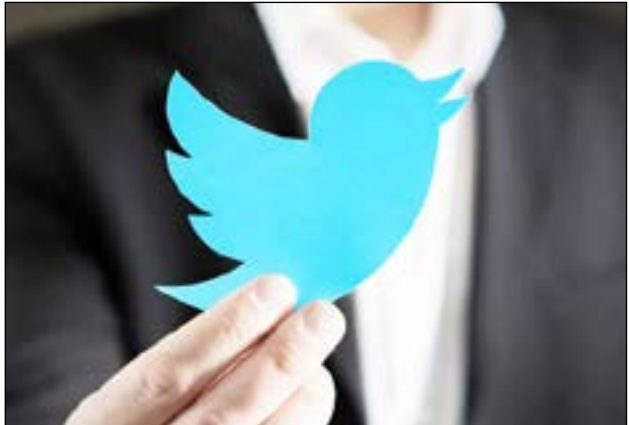
توئیت‌های مردم ایران در شبکه‌های اجتماعی

تقریباً تمام توئیت‌هایی که تاچندی پیش پیام رئیسی منتشر می‌شد اغلب خبرگزاری‌های رسمی کشورهای حامی رئیسی و سایر رسانه‌ها، بازنشر دادند و این روند با تکذیب و توضیحی از سوی تیم رسانه‌ای «پاستور» مواجه نشد و همگی با سکوت بدرقه شدند و بر این اساس، از سوی افکار عمومی به عنوان نظر شخص ابراهیم رئیسی ارزیابی می‌شدند و ملاک عمل تصمیم‌سازان و تصمیم‌گیران دولتی قرار می‌گرفتند. اکنون این ضرورت احساس می‌شود که تیم رسانه‌ای و سایر مسئولان ذیربط دولت‌سیزدهم درباره تکذیب دیر هنگام خودآزمین‌وآزمین‌هایی که حداقل یک‌سال به جای رئیس جمهور توئیت می‌زدند، توضیح دهند و شفاف‌سازی کنند.