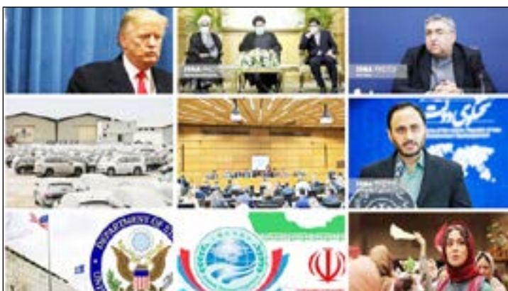
فرجام‌خواهی یک حکم دیگر

شروط، جمهوری اسلامی تعهدات سابق خود در توافق سال ۲۰۱۵ یا همان برجام سال ۱۳۹۴ اجرائی کند. به گفته سخنگوی دولت لایحه «الحاق ایران به سازمان همکاری شانگهای» تقدیم مجلس شد. علی بهادری جهرمی در توئیتی ضمن اعلام این خبر نوشت: لایحه «الحاق دولت جمهوری اسلامی ایران به سازمان همکاری شانگهای» پس از تصویب در دولت، جهت طی تشریفات قانونی تقدیم مجلس شد.