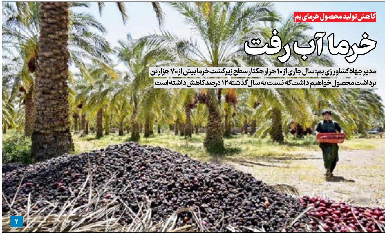
کاهش تولید محصول خرماي بم