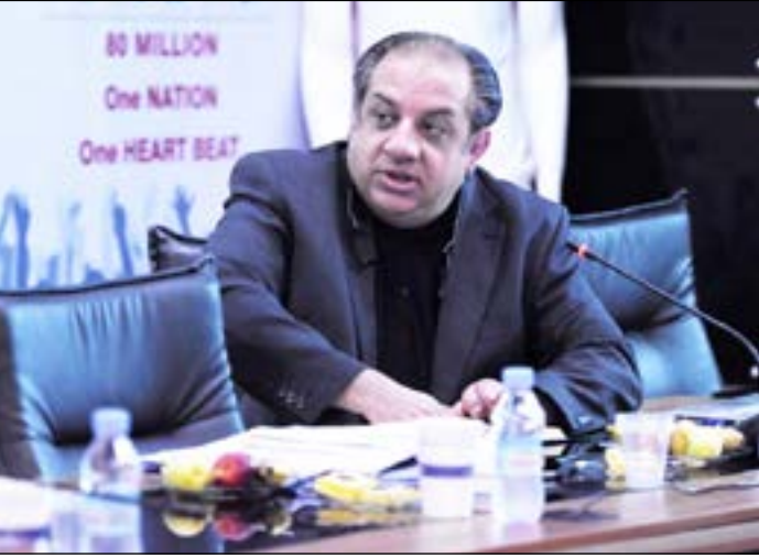
اردو، یک بازی قبل از جام جهانی داشته باشیم اما جزئیات آن اطلاعی نداریم. وی در پاسخ به این پرسش که آیا کی‌روش برنامه مسابقات لیگ را بر هم نزد، تاکید کرد: اما اگر هم هست من اطلاعی ندارم. ما در این حالت با وجود برنامه عملیاتی نمی‌توانیم اردوی داشته باشیم. شاید این اردو برای جام ملت‌های آسیا باشد از قبل از اینکه برای جام جهانی به قطر بروند چند روزی در امارات باشند.