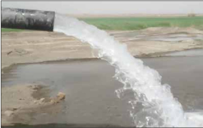
روزنامه صبح پهنانروز استان ایران

استاندارد برداشت آب از منابع تجدید شونده، سالانه ۴۰ درصد است، این رقم، در کشور ۹۰ درصد و در کرمان به تعبیر کارشناسان «در حد فاجعه» و ۱۱۵ درصد است.