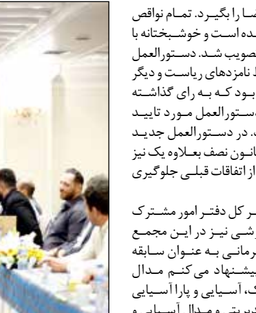
کاغذ ورزش ۳

وی در پاسخ به این پرسش که عدم حضور ایران در بازی های تدارکاتی بین المللی چه تاثیری بر عملکرد تیم کشورمان در قهرمانی جهان خواهد داشت، تصریح کرد: در این رقابتها با تیم هایی چون برزیل، ایتالیا، کانادا و آمریکا رقابت خواهیم کرد که اکثر آنها در بازی های پارالمپیک حضور داشتند و به طور مرتب در تورنمنت های بیرون مرزی شرکت کردند، در حالی که تیم ما بعد از ۴ سال وارد مسابقات می شود و چند نفر از بازیکنان اولین تجربه بین المللی آنها است. قطعاً این مساله در عملکرد آنها بی تاثیر نخواهد بود.