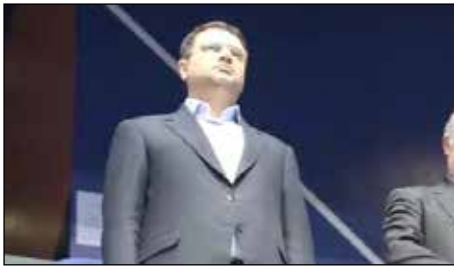
کاغذ ورزش ۳

انتصاب احتمالی اصولی به عنوان رییس سازمان فوتسال آن هم در حالی که وی در یک سال اخیر کار مثبتی را در این رشته انجام نداده، از دید پیشکسوت فوتسال این رشته کار درستی نخواهد بود.