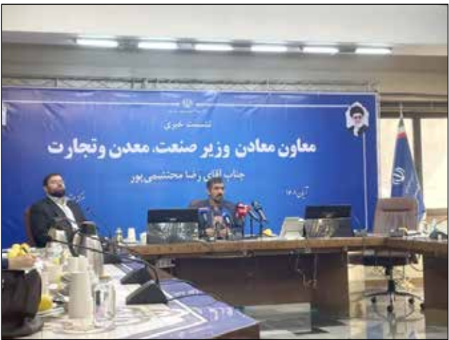
سید رضا محتشمی پور

سید رضا محتشمی پور در نشست صبح روز گذشته (یکشنبه) خود که در محل وزارت صمت برگزار شد، در پاسخ به پرسش به ایسنا، مبنی بر اینکه همچنان علیرغم ممنوعیت خام‌فروشی مواد معدنی، برخی فعالان حوزه معادن بر صادرات مواد معدنی اشاره دارند، تصریح کرد: آمار بخش معدن نشان می‌دهد که کل صادرات مواد معدنی کشور در بالاترین برآوردها به ۲۲٪ کل تولید مواد معدنی نمی‌رسد. همچنین آمارها حکایت از این دارد که سال گذشته ۶۱۷ میلیون تن تولید مواد معدنی داشته‌اند، بالاترین میزان صادرات معدنی در کشور ۱۰ میلیون تن بوده است. در حوزه معدن، به آن مفهومی که برخی ادعا می‌کنند، خام‌فروشی مواد معدنی در صادرات مواد معدنی در عملکرد حوزه معدن، بسیار پایین است. معاون معادن و قیرآوری مواد و وزیر صمت ادامه داد: عمده مواد معدنی که صادر می‌شود، موم است که مورد نیاز برای قیرآوری در داخل کشور نیستند؛ همچون سنگ آهن همتا، تیتیم، گیبس، هماتیت، کربن، به لحاظ وزنی، یکی از بزرگترین برش‌های صادرات مواد معدنی کشور حدود ۱.۵ میلیون تن به خود اختصاص داده است. این ۱.۵ میلیون تن، مواد معدنی است که به میزان بسیار اندکی در داخل نیست. با توجه به اینکه اساساً معدن از این حوزه معدن، حوزه تأمین مواد اولیه و ماده اولیه