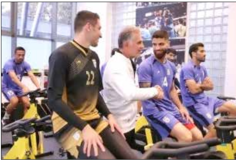
کاغذ ورزش ۳

با توجه به عدم جذب مدافع چپ جدید در پرسپولیس و مصدومیت وحید امیری در ابتدای فصل فرصت بازی و دست یابورد، اما این اتفاق برای او نینفاد و تاکنون فقط یکبار برای سرخ پوشان به میدان رفته ولی عملکردش در تیم های پایه فوتبال ایران موجب شده حالا به اردوی بزرگسالان دعوت شود.