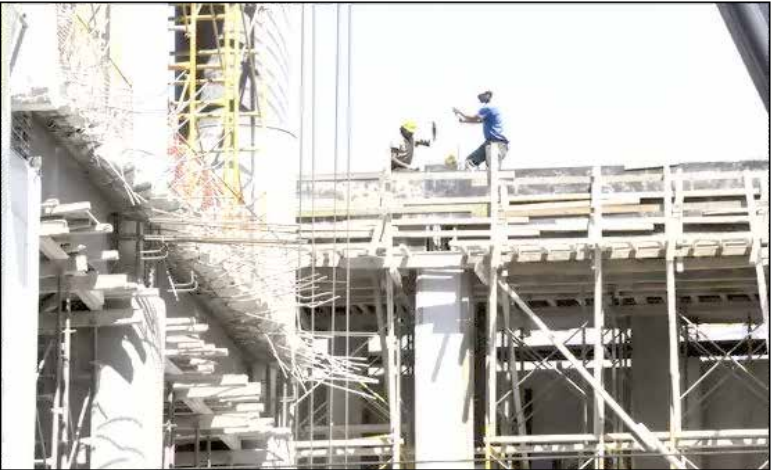
عین‌مشتریان از آن

بنابراین اگر دولت و وزارتخانه‌ها از وضعیت بغرنج فعالن صنعت ساختمانی غافل باشند که هستند نتیجه همین خواهد شد که می‌بینیم. نتیجه کمبود و کسری چندین میلیون واحد مسکونی در کشور می‌تواند موجب مشکلات