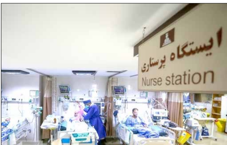
بنابر این ۱۷ هزار نیرو نیز در این زمینه باید به ما مجوز استخدام ارائه دهند.