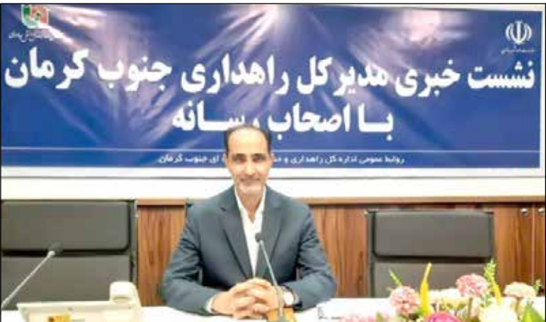
روابط عمومی اداره کل راهداری و حمل و نقل جاده ای جنوب کرمان

مدیر کل راهداری و حمل و نقل جاده‌ای جنوب کرمان: جنوب کرمان از لحاظ رتبه دوازدهم یا سیزدهم قرار دارد ولی به لحاظ تعداد ماشین آلات راهداری در رتبه آخر قرار دارد.