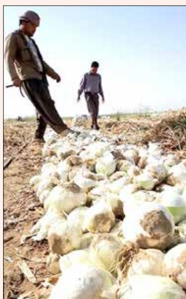
مجموع پیاز به بازار مصرف به دلیل عرضه زیاد محصول در زمان اندک الزامی است.

وی ادامه داد: بازار تا حد زیادی اشباع شده است و دلالان و میدان داران نیز پیازهای انبار شده از ماه‌ها قبل را وارد بازار کرده‌اند که این امر موجب افت قیمت محصول در بازار مصرف می‌شود و در نهایت موجب ضرر کشاورز می‌شود. وی گفت: متأسفانه هیچ کارخانه فراوری نیز در جنوب کرمان در خصوص این محصول وجود ندارد و با توجه به نزدیکی به کشورهای عربی حوزه خلیج فارس باید زمینه صادرات محصول مهیا شود. وی گفت: موانع صادرات باید رفع شود تا بتوانیم محصول را صادر کنیم و پیاز روی دست کشاورز نماند.