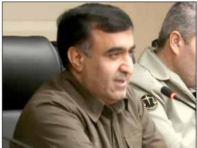
سراسر کشور تاکید داریم و شورای عالی محیط زیست کشور نیز به صورت منظم برگزار می شود. رئیس سازمان حفاظت محیط زیست با بیان اینکه

معاون رئیس جمهور و رئیس سازمان حفاظت محیط زیست گفت: هیچ پروژه های بدون پیوست زیست محیطی در کشور آغاز نمی شود. علی سلاجقه ۸ دی در نشست با فعالان محیط زیست و اساتید گروه منابع طبیعی و محیط زیست دانشگاه های استان اردبیل گفت: عزم دولت سیزدهم بر آن است تا هیچ پروژه ای بدون پیوست زیست محیطی در کشور آغاز نشود. وی با بیان اینکه رویکرد حل مساله در دولت حاکم است، افزود: دولت در تمامی ابعاد رویکرد زیست محیطی به خود گرفته است. سلاجقه با بیان اینکه بودجه ۱۴۰۲ کشور حاوی پیام زیست محیطی است، تصریح کرد: به توجه ویژه به محیط زیست در