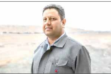
مدیر روابط عمومی و امور بین الملل شرکت سنگ آهن گهر زمین از برنامه های این شرکت در آستانه سومین سالگرد شهادت حاج قاسم سلیمانی خبر داد.