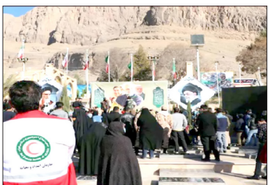
به همت اعضای جوانان افزود: روزانه بیش از ۱۲ عضو جوان در حسینیه ثارالله، بیت الزهراء، مصلی امام علی (ع) و گلزار شهدای کرمان در ایام گرامیداشت سالگرد شهادت حاج قاسم سلیمانی