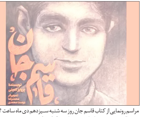
مراسم رونمایی از کتاب قاسم جان روز سه شنبه سیزدهم دی ماه ساعت ۱۴ در سالن وحدت در سازمان حج و زیارت خواهد شد.

آیین رونمایی از کتاب «قاسم جان» که راوی دوران جوانی شهید حاج قاسم سلیمانی است هم‌زمان با سومین سالگرد این شهید برگزار می‌شود. به گزارش ایرنا از پایگاه اطلاع‌رسانی حج، هم‌زمان با سومین سالگرد عروج ملکوتی شهید سپهبد حاج قاسم سلیمانی، آیین رونمایی از کتاب قاسم جان که راوی دوران نوجوانی این شهید عزیز است با حضور دست‌اندرکاران نگارش کتاب و فعالان فرهنگی، حوزوی و دانشگاهی در سازمان حج و زیارت برگزار می‌شود. این کتاب به همت موسسه فرهنگی هنری مشعر به قلم پرویز امینی و تصویرگری محمدرضا دوست محمدی چاپ و راهی بازار نشر شده است. کتاب قاسم جان که در ۵۶ صفحه منتشر شده، تلاش شده است که قصه ای کوتاه از کودکی این شهید بزرگوار و کوچ او در دوران نوجوانی از بخش رابر به شهر کرمان مستند شود. در مقدمه این کتاب آمده است: قاسم جهان را باید از همان دوران کودکی شناخت و همه وجودش در پاکی غریب و زندگی او در پاری به انسان‌ها به پایان رسید. او اولین شهیدی بود که با شهادت چشم به جهان گشود.