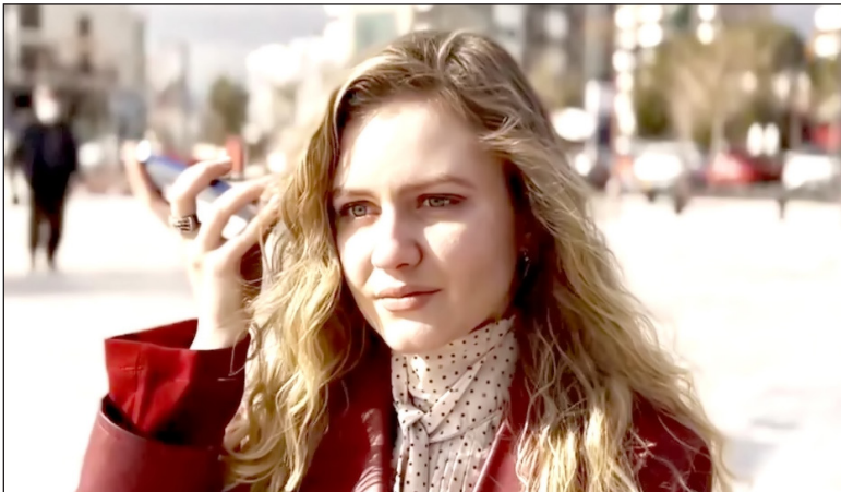
نکی کریمی در سریال تمام رخ

از ساره بیات و نیکی کریمی خیلی خوشم می‌آید بازیگر ایرانی مرد و زن مورد علاقه شما کیست؟ از نیکی کریمی و ساره بیات خیلی خوشم می‌آید. در بین بازیگران مرد نمی‌توانم تنها یک نفر را انتخاب کنم چون خیلی‌ها مورد علاقه‌ام هستند. چند دوست ایرانی دارید و بیشتر دوستان ایرانی شما آیا بازیگر هستند؟ دوستان ایرانی زیادی دارم. بعضی هاشان بازیگرند ولی خیلی‌ها هم هیچ ربطی به فضای سینما ندارند. چند بار به ایران سفر کردید و در سفر به ایران کجاها رفتید و از چه جاهایی بازدید داشتید؟ تقریباً ۱۰ بار به ایران سفر کرده‌ام و دفعه آخر تقریباً ۶ ماه در ایران بودم. به شهرهای مختلف ایران سفر کردم از جمله اصفهان، شیراز، یزد، به شمال ایران زیاد سفر کرده بودم و دفعه آخر از شهر ماسوله با دوستانم بازدید کردیم که واقعاً بی نظیر بود.