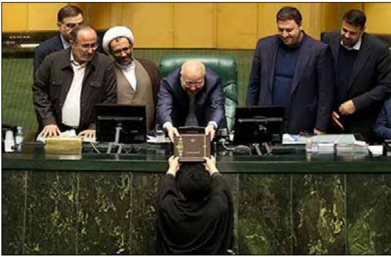
مجلس شورای اسلامی

کردیم و الان دوباره کم آوردیم و در کنار مالیات، نفت و انتشار اوراق، فروش اموال را در دستور کار قرار دادیم. وی ادامه می‌دهد: عملاً مسیری که در نظام بودجه‌ریزی طی می‌شود، هیچ‌گونه ارتباطی با حل مسایل کشور ندارد و هیچ‌کجا دنیا هم من سراغ ندارم که این همه کارمند رسمی داشته باشیم، ما فقط الان دنبال این هستیم که حقوق دستمزد کارمندان دولت را پرداخت کنیم، ولی نکته این‌جاست که چقدر بهره‌وری در اقتصاد ایران وجود دارد.