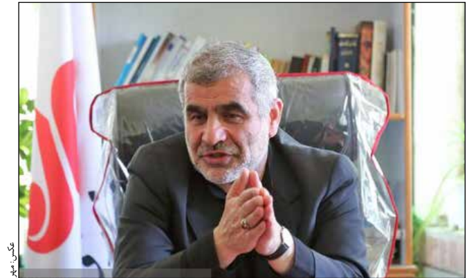
سید کاظم موسوی

نائب رئیس مجلس شورای اسلامی خبر داد: تیم اقتصادی دولت منسجم عمل کند