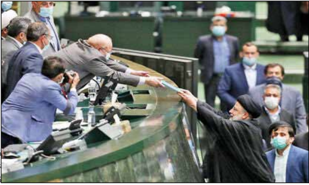
اقتصادی ایران و حل مسائلی اقتصادی ایران خواهد بود.