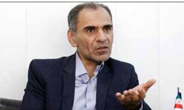
ندری، کارشناس اقتصاد:

فرماندار جیرفت: از جمعیت شهری ۴۰ هزار خانوار، برای حدود چهار هزار خانوار لوله کشی گاز انجام شده است که نمی توان به این دلیل، سهمیه زمستانی شهر جیرفت را کاهش داد