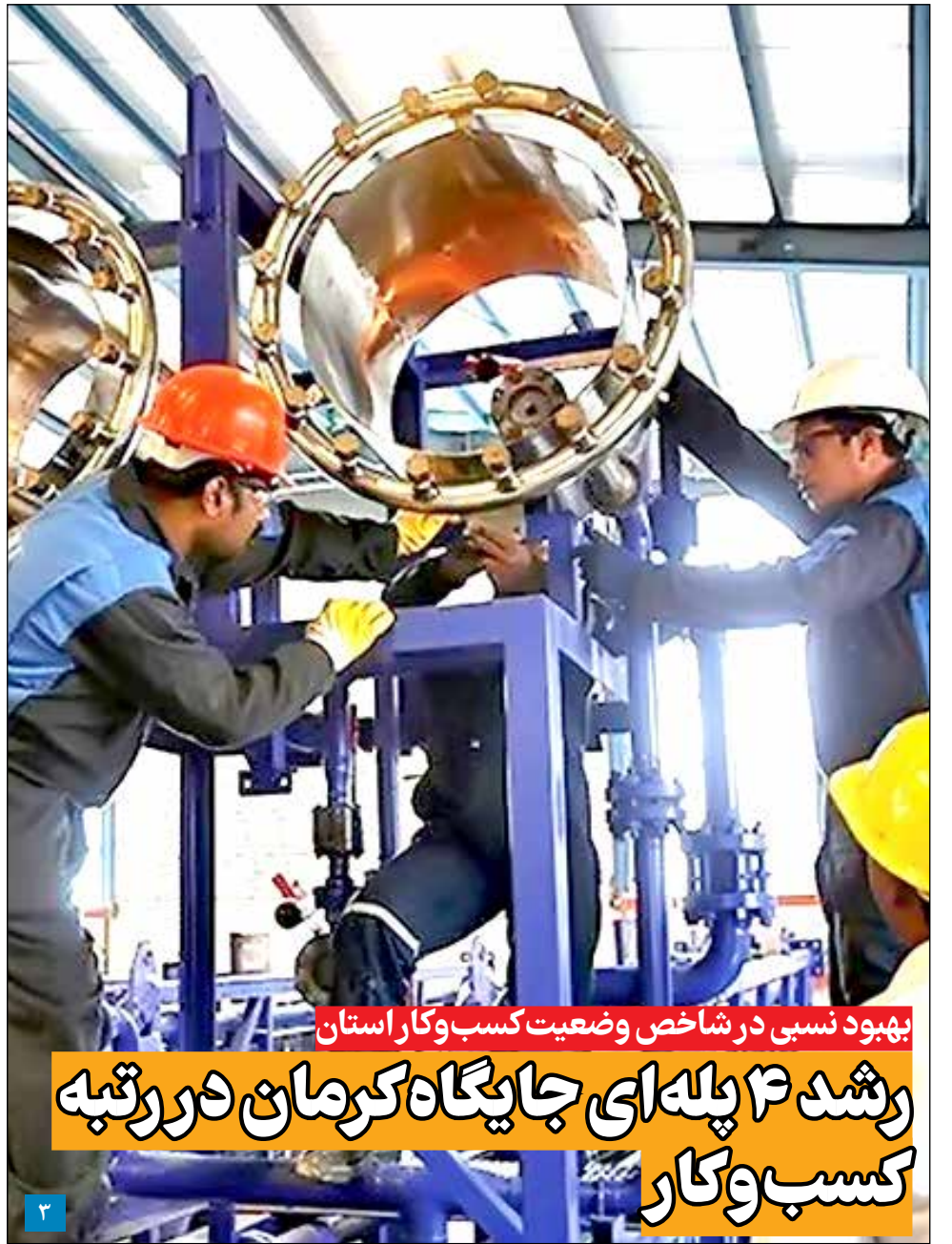
بهبود نسبی در شاخص وضعیت کسب و کار استان