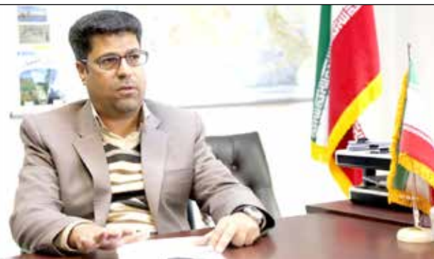
مدیرکل راه و شهرسازی جنوب کرمان خبر داد: