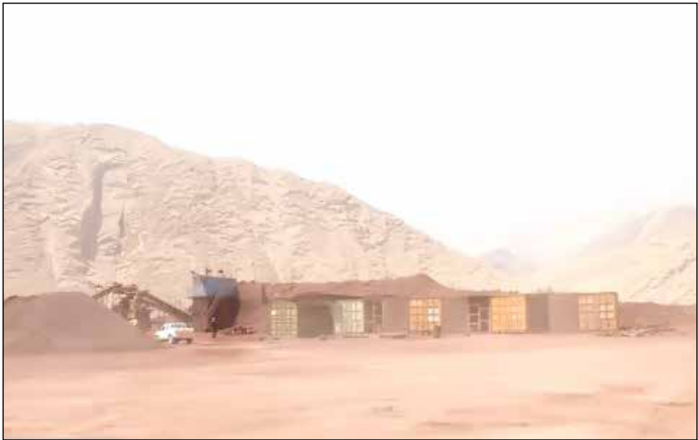
۱۶- درصدی مواجه بوده است.

در فصل پاییز ۱۴۰۱، درصد تغییرات شاخص قیمت تولیدکننده بخش معدن نسبت به فصل مشابه سال قبل (تورم نقطه به نقطه) ۷.۹ درصد می باشد که در مقایسه با همین اطلاع در فصل قبل (۱۳.۴ درصد)، ۳.۷ واحد درصد کاهش داشته است. به