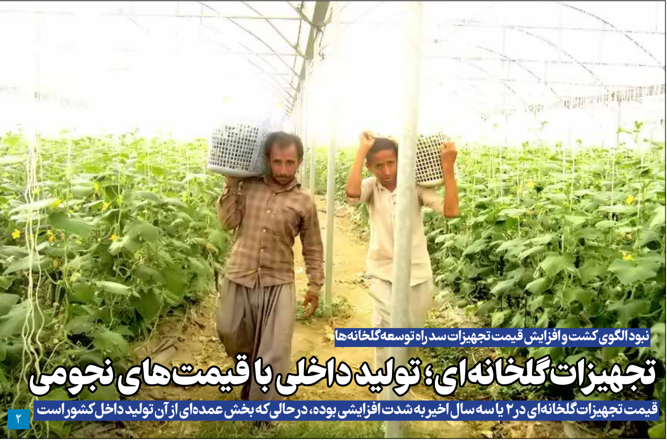
نبود الگوی کشت و افزایش قیمت تجهیزات سد راه توسعه گلخانه ها

در جلسه شورای مسکن موضوع تامین زمین مقااضیان نهضت ملی مسکن در کرمان مطرح شد. استاندار درباره تامین زیرساخت های اراضی نهضت ملی مسکن گفت: تا ۲ هفته آینده جلسه مشترک