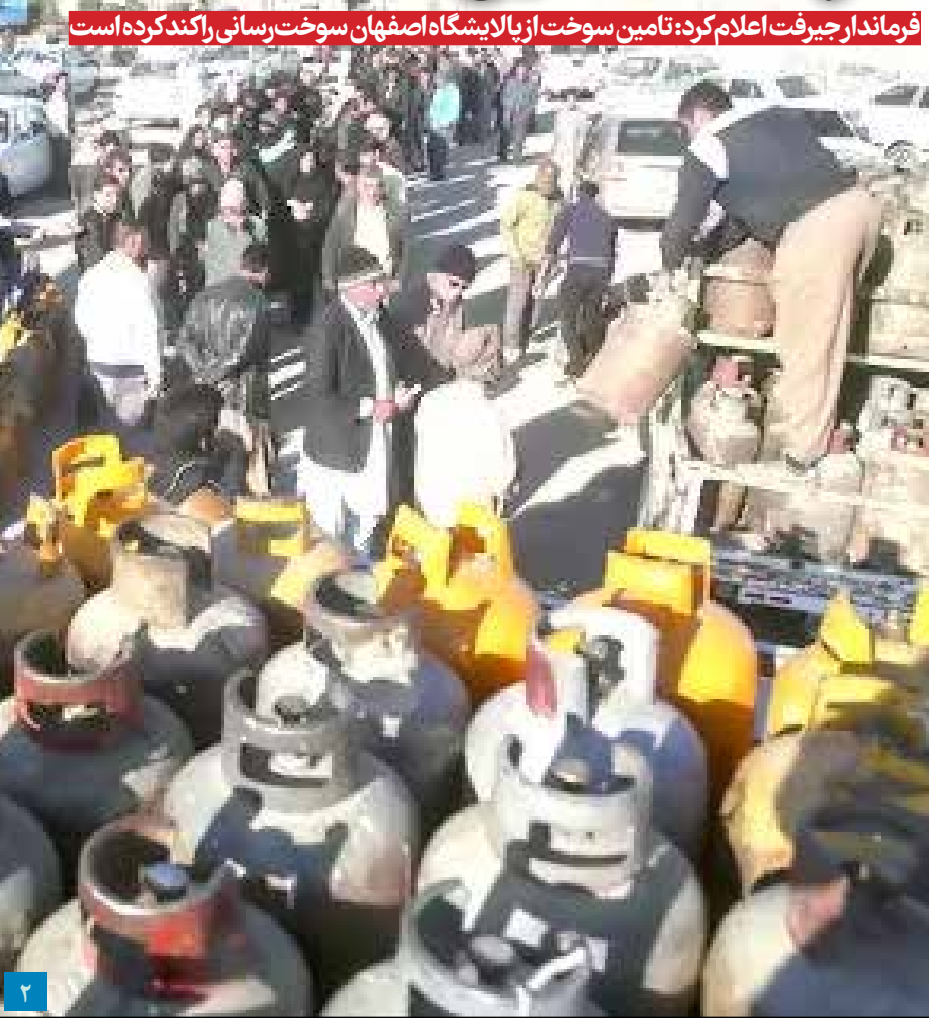
فرماندار جیرفت اعلام کرد: تامین سوخت از یالایشگاه اصفهان سوخت‌رسانی را کند کرده است

امام جمعه کرمان: ضعف‌ها سبب ندیدن پیشرفت‌های کشور نشود نماینده ولی فقیه و امام جمعه کرمان گفت: نباید چشم بر ضعف‌ها بیندیم اما در عین حال اینطور نباشد که پیشرفت‌های کشور را نادیده بگیریم که این، یک تحلیل انقلابی است. مدیرکل حمل و نقل جاده‌ای جنوب کرمان مطرح کرد: کشاورزان کمک بگیرند مدیرکل حمل و نقل جاده‌ای جنوب کرمان مطرح کرد: کشاورزان کمک بگیرند