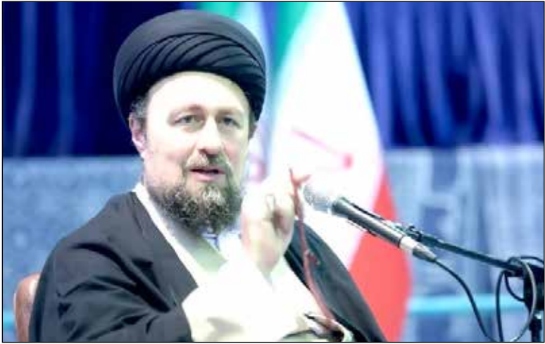
سید حسن خمینی

وی در بخش دیگری از سخنان خود در خصوص فعالیت احزاب گفت: متأسفانه احزاب یا جریان‌های سیاسی ما بین همین دو گانه دچار گیجی هستند؛ یا ضد مردمی می‌شوند، به این معنا که می‌گویند باید روی حقیقت بایستیم و مردم هیچ نقشی در زندگی سیاسی ندارند، و یا یکسره دنبال اکثریتی راه می‌افتند. این در حالی است که احزاب نباید دنبال اکثریت بروند، بلکه باید دلیل نیست که حق نیست؛ حق بودن ربطی با اقتدار ندارد. پس دوباره تلاش می‌کنم تا بتوانم، یادگار امام در پایان گفت: اگر هیجان از حد معینی بالا برود جامعه دچار شکاف، گسل و دعوا می‌شود، اینکه فقط اطراف خودمان را ببینیم غلط است. ممکن است اطرفیان من یک طور فکر کنند و اطرفیان شما طور دیگر فکر کنند؛ فکر نکنیم جامعه یکسان می‌اندیشد.