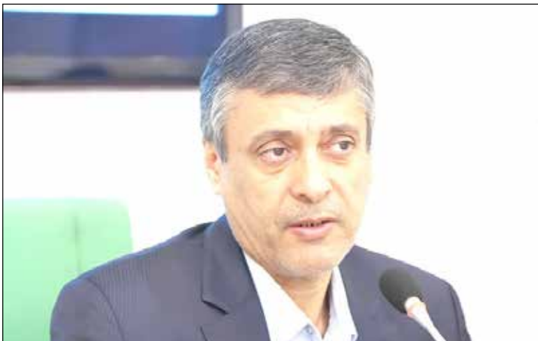
رئیس اتاق بازرگانی استان کرمان

رئیس اتاق بازرگانی استان کرمان می گوید به این نتیجه رسیده ایم که باید توسعه گلخانه ها را داشته باشیم، اما با وجود توسعه کمی، توسعه کیفی و تکنولوژی گلخانه های رانداشته ایم