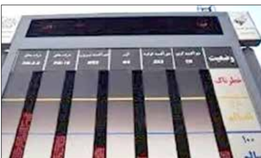
و نصب این ایستگاه‌ها به اتمام رسیده که نمایشگر پایش هوای رفسنجان در میدان آزادی و در سر چشمه در محل کارخانه نصب

رئیس اداره محیط زیست رفسنجان عنوان کرد: ایستگاه سنجش آلاینده‌های هوا در رفسنجان در محل دفتر مرکزی دانشگاه علوم پزشکی رفسنجان مستقر است. آلودگی هوا در حال حاضر اکثر آنالیزورهای لازم برای این ایستگاه ها نصب شده و در صورت اتصال برق، در اسرع وقت بهره برداری از آنها آغاز خواهد شد. او راه اندازی ایستگاه سنجش آلودگی هوا در رفسنجان را با توجه به تعدد صنایع یک ضرورت خواند و گفت: در این ایستگاه ها گازهایی که از دید آنها سلامت مردم را به خطر می‌اندازد مورد پایش و سنجش قرار می‌گیرد که با توجه به موقعیت جغرافیایی شهرستان، وجود این ایستگاه‌ها بسیار ضروری است.