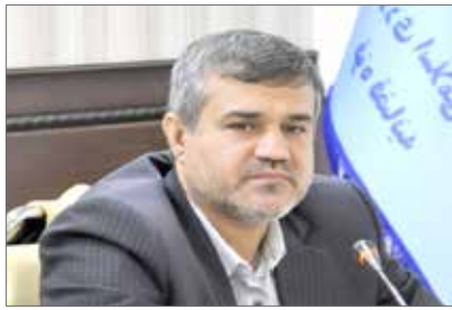
مدیر کل راهداری جنوب کرمان از وجود ۸۹ نقطه حادثه خیز شناسایی شده که ۷۴ نقطه اصلاح اساسی انجام و ۱۵ نقطه با همکاری ادارات راهداری و حمل و نقل جاده‌ای شهرستانها و اداره ایمنی و حریم اداره کل ایمن سازی و برای سفرهای نوروزی آماده شده است.

سامانه ارتباط مستقیم شهروندان با دادستان کرمان راه اندازی شد. دادستانی کرمان گفت: با راه اندازی سامانه ارتباط مستقیم شهروندان با دادستان عمومی و انقلاب مرکز استان، عموم مردم می‌توانند از طریق شماره ۰۹۹۳۰۶۵۳۰۴۳ مشکلات خود را بدون واسطه با مدعی‌العموم در استان مطرح کنند. در این سامانه امکان دریافت مستقیم گزارشات مردم در موضوعات اطلاع دادرسی، انتقاد به فرایند دادرسی، انتقاد به نحوه اجرای آراء قضایی کیفری، درخواست ملاقات حضوری، انتقاد به رفتار و عملکرد و دریافت گزارش معضلات و مشکلات اجتماعی وجود دارد. عموم مردم می‌توانند مشکلات و انتقادات خود را از طریق پیام رسان‌های مطرح داخلی از جمله ایستا، بله، روبیکا، سروش و... با دادستان عمومی و انقلاب مرکز استان مطرح کنند. در این سامانه همچنین امکان ارسال فیلم و عکس نیز برای عموم مردم فراهم است. هدف از راه اندازی این سامانه، تحقق رویکردهای مردم محور قوه قضاییه و توسعه ارتباط میان مقامات قضایی با بدنه جامعه در راستای رسیدگی به مسائل، مشکلات و مطالبات مردمی است.