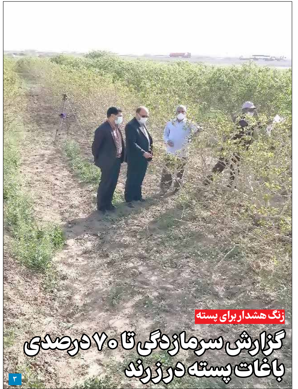
زنگ هشدار برای پسته

تنها مدرسه اوتیسم در کرمان با ۳۵ دانش آموز