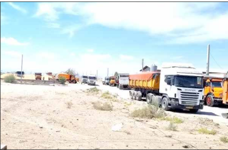
درخواست ۳۰۰ تا ۳۵۰ هزار تومان برای هر تن گندم می‌کنند که حمل یک بار ۱۰ تنی تا سه میلیون و ۵۰۰ هزار تومان برای کشاورز هزینه

یک کشاورز قلعه گنجی هم گفت: شرایط حمل و نقل به شکلی است که باید یک یا ۲ روز گندم ما بر روی زمین بماند تا کامیونی برای حمل آن پیدا شود. شعیب میردوستی افزود: کامیون‌ها برای حمل