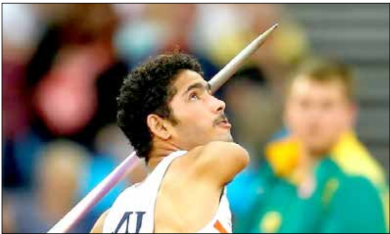
مدال آری می‌باشد، پیش‌بینی ما اعزام ۵۰ ورزشکار شانس کسب مدال به این بازی‌ها است که از این تعداد ۱۵ نفر از زنان تشکیل خواهند داد. سرمری تیم ملی پارادوومیدانی در پایان درباره وضعیت تجهیزات دوومیدانی کران نیز گفت: فدراسیون و کمیته ملی پارالمپیک تا به امروز

وی در پاسخ به این پرسش که تصور می‌کنید با چه تعداد دوومیدانی کار در بازی‌های پارا آسیایی هانگژو چین حضور داشته باشیم، تصریح کرد: چون سیاست کمیته ملی پارالمپیک در این دوره اعزام کیفی و