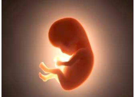
عکس همشهری آنلاین

معاون درمان وزارت بهداشت با اشاره به رانندگی و ابلاغ سامانه ملی باروری سالم، گفت: بیش از ۱۰۰ پرونده در زمینه سقط غیرقانونی، به مراجع قضایی ارسال شده و امیدواریم بر خورد‌های جدی و بازدارنده با این پرونده‌ها انجام شود. به گزارش کاغذ وطن به نقل از ایسنا، کریمی درباره بحث انجام سقط‌های جنین غیرقانونی و راهکارهای پیشگیری از آن، گفت: پیرو جلسه‌ای که با رئیس جمهور داشتیم، پرونده‌هایی که در این زمینه وجود داشت، برای رئیس قوه قضاییه و دادستان کل کشور ارسال کردیم. بر خورد با سقط جنین غیرقانونی کار تفتد یک ارگان نیست؛ زیرا این اقدام عمدتاً در جاهایی اتفاق می‌افتد که وزارت بهداشت نمی‌تواند آن را مورد نظارت قرار دهد. به عنوان مثال مگر وزارت بهداشت می‌تواند وارد خانه مردم شود و نظارت کند؟