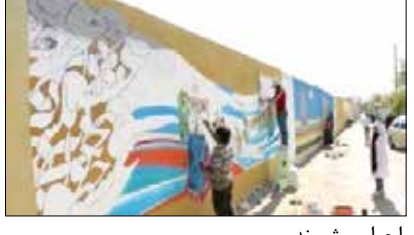
برگزاری جشنواره دیوارنگاری رفسنجان می‌تواند ضمن تماشای کار هنرمندان، از برنامه‌های جانبی نیز استفاده کنند.