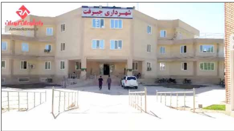
افراد به دلیل ورود سازمان بازرسی اخراج شده اند اما با بازرسی صحت کردیم و گفتند که همچنین تصمیمی در این مورد نگرفته ایم.

عضو شورای شهر جیرفت به «کاغذ وطن» خبر داد: «خلاف قانون است