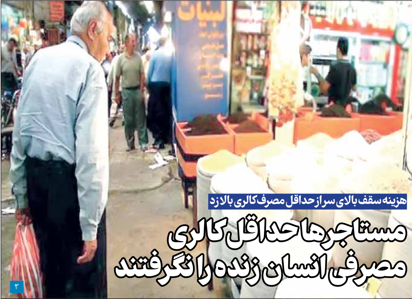
هزینه سقف بالای سر از حداقل مصرف کاری بالازد

رئیس بنیاد ملی گندم کاران کشور: بانک ها مکلف شده اند حداقل ۱۵ درصد از منابع داخلی خود را صرف تسهیلات بخش کشاورزی کنند اما به دلایل مختلفی بجز بانک کشاورزی بقیه امتناع می کنند