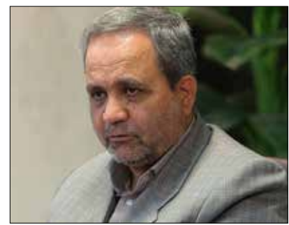
فرهنگی و اجتماعی اشاره و بر سیاست گذاری و برنامه

رزی به منظور بهره گیری از توانمندی های این قشر در عرصه های مختلف تاکید کرد. فرماندار سیرجان تصریح کرد: بهره گیری از توانمندی نخبگان می تواند راه رسیدن به توسعه را به نحو مطلوبی فراهم کند در این بین آنچه مهم و کارساز محسوب می شود، فراهم آوردن زمینه های مساعد برای حضور پررنگ نخبگان و دانشمندان در عرصه های مختلف جامعه است. او با اشاره به تدوین سند توسعه شهرستان سیرجان از همه صاحب نظران و نخبگان دعوت کرد که فارغ از دیدگاه ها و سلیق سیاسی، در راستای تهیه و تدوین این اسناد، همکاری و تعامل داشته باشند.