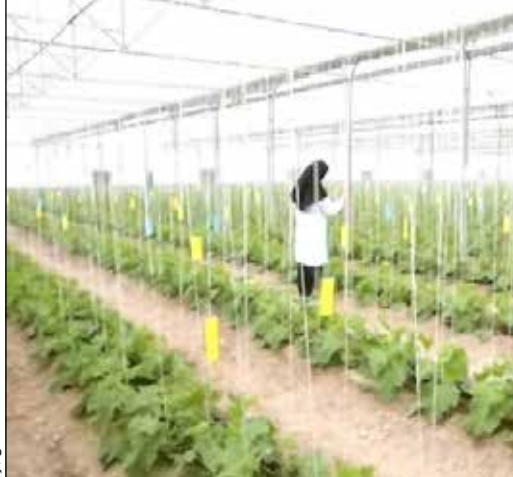
از دست دادن منابع آبی کشور است در خصوص افزایش هزینه های تاسیس و راه اندازی گلخانه ها می گویند: هزینه ها به شدت بالا رفته به طوری که سال گذشته احداث هر متر گلخانه حدود ۴۰۰ میلیون تومان داشته و الان به بیش از ۶۰۰ میلیون تومان رسیده است. در واقع از سال قبل تا الان تا ۵۰ درصد رشد تورمی داشته است.