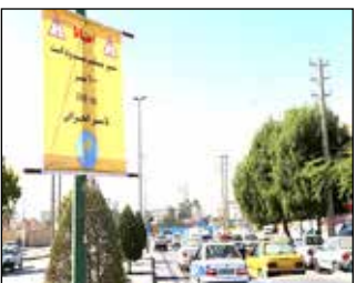
رئیس پلیس راهنمایی و رانندگی استان کرمان گفت: پیمانکاران قبل از اجرای عملیات عمرانی در معابر عمومی باید پلان ایمنی خود را به پلیس ارائه و تاییدیه لازم را دریافت کنند.