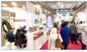
سی امین نمایشگاه بین المللی صنایع کشاورزی، مواد غذایی، ماشین آلات و صنایع وابسته -ایران «گروفت ۲۰۲۳» در تهران آغاز به کار کرد.

حضور پلویون انجمن صنایع غذایی استان کرمان در نمایشگاه بین المللی مواد غذایی