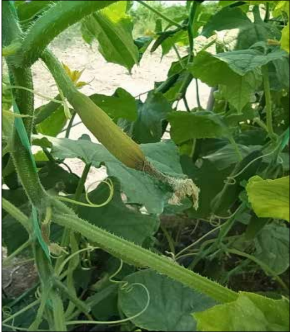
علائم بیماری روی میوه

یکی از بیماری‌های مهم خیار کبک خاکستری است که در اکثر نقاط دنیا از اهمیت بالایی برخوردار است. عامل بیمارگر گونه‌ی Botrytis cinerea. گونه‌ای نکروتروف با گستردگی جهانی و دامنه میزبانی گسترده است که می‌تواند بیش از ۲۰۰ محصول مهم اقتصادی را آلوده کند. استفاده از قارچ‌کشا، موثرترین روش در مدیریت این بیماری است. قارچکشاهای متعددی برای استفاده در مدیریت بیماری کبک خاکستری خیار در کشور ثبت شده‌اند. از آنجایی که استفاده مداوم از قارچ‌کشا امکان بروز مقاومت به آنها را بیشتر میکند لذا دسترسی کشاورزان به قارچکشاهایی از خانواده‌های مختلف شیمیایی با محل اثر و مکانیسم اثر متفاوت امکان مدیریت بهینه و هوشمند بیماری را فراهم میکند. بر اساس نتایج حاصل از این مطالعه و نظر به اینکه کنترل کامل تر کبک خاکستری نکته مهم در مدیریت این بیماری است، غلظت ۰/۸ تا ۱ در هزار قارچکس سونچ با فاصله زمانی ۷ روز غلظت ترجیحی برای توصیه برای محلول پاشی است.