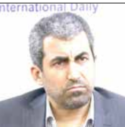
رئیس پلیس راهنمایی و رانندگی استان کرمان گفت: پیمانکاران قبل از اجرای عملیات عمرانی در معابر عمومی باید پلان ایمنی خود را به پلیس ارائه و تاییدیه لازم را دریافت کنند.

رئیس کمیسیون اقتصادی مجلس با بیان اینکه ۴۰ درصد از ظرفیت معادن کشور در استان کرمان وجود دارد، گفت: متأسفانه علیرغم پتانسیل های موجود، میزان اکتشافات معادن در کشور بسیار پایین است. نماینده مردم کرمان و راور در مجلس در مراسم بازدید اعضای کاروان روایتگران پیشرفت از کارخانه لاستیک بارز کرمان با اشاره به پتانسیل های بی نظیر معدنی استان کرمان افزود: چند سال قبل فقط خام فروشی معادن را داشتیم، اما امروز در همت جوانان کرمانی و مجهز شدن به دانش روز و توسعه زیرساخت ها، زنجیره تولید فولاد در استان کرمان تکمیل و خام فروشی جلوگیری شده است. به گفته او متأسفانه علیرغم پتانسیل های موجود، میزان اکتشافات معادن در کشور، بسیار پایین است. رئیس کمیسیون اقتصادی مجلس با تقدیر از برگزاری همایش روایتگران پیشرفت گفت: این رخداد یک اقدام بسیار خوب در جهت تحقق فرمان رهبر معظم انقلاب اسلامی در ارتباط با جهاد تبیین است.