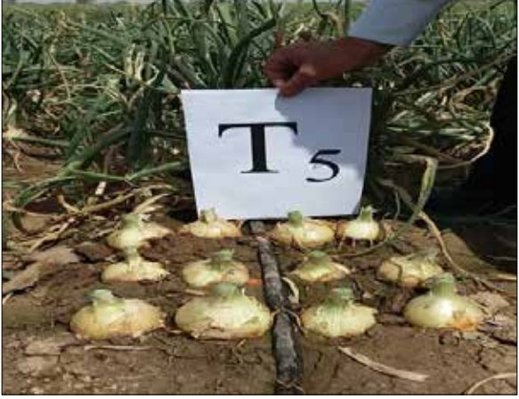
تیمار T5 یافته پروژه فوق است

کاهش سطح مصرف نیتروژن از ۲۷۶ کیلوگرم در هکتار (عرف زارع) به ۱۴۰ کیلوگرم در هکتار به همراه مصرف ۱۰ تن کود مرغی و استفاده بهینه سایر عناصر غذایی در تولید پیاز و سیب‌زمینی در زمستان، ضمن دستیابی به تولید اقتصادی و معنی‌دار از نظر کمی، غلظت نیترات را هم در هر دو محصول به پایین‌تر از حد بحرانی رساند.