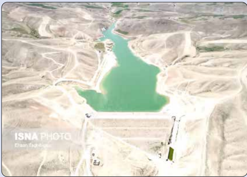
ISNA PHOTO Ensan, Fardis