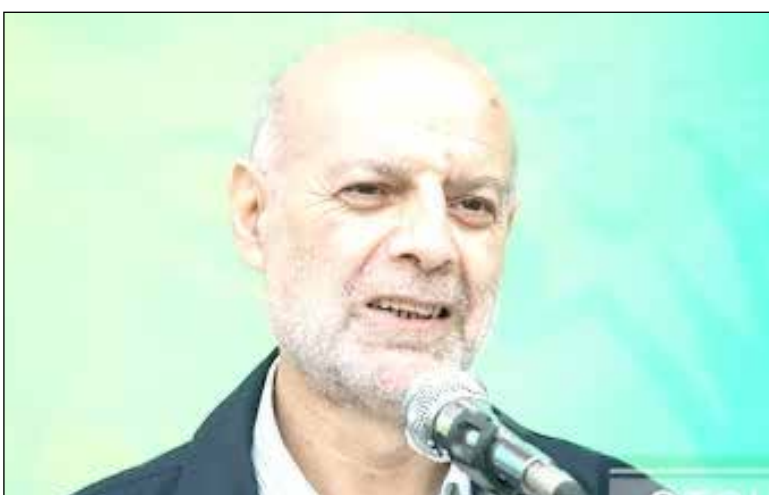
جاده و مسیر را از همان فرد گرفت تا جاده و آسفالت مناسب آن خودرو ایجاد شود!

نماینده تام‌الاختیار وزارت کشور در قرارگاه