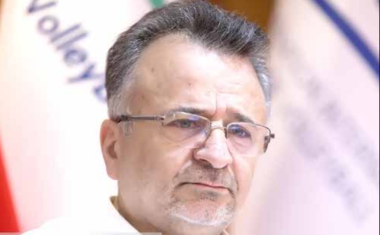
رئیس فدراسیون والیبال ایران

با بیان اینکه مصوبه هیات رئیسه فدراسیون جهانی این است که امتیاز ما و وریبا بعد در هفته سوم فریز شود و برای آنها هم امتیازی کم یا زیاد نخواهد شد، ادامه داد: قرار نیست فقط ما آسیب ببینیم. به همین دلیل فدراسیون جهانی در مصوبه خود این موضوع را در نظر گرفت، چون رفتار آمریکا خلاف منشور المپیک و بازی جوانمردانه است. کشوری که دم از اقتدار و قدرت می زند یا چنین رفتارهای نشان می دهد که خیلی با چیزی که می گوید فاصله دارد.