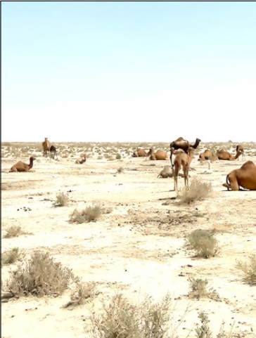
انتهای مسیر به سد جیرفت وارد می شود و در نیمه مسیر خود به خشک رودی تبدیل می شود تا مزارع جیرفت را آبیاری کند.