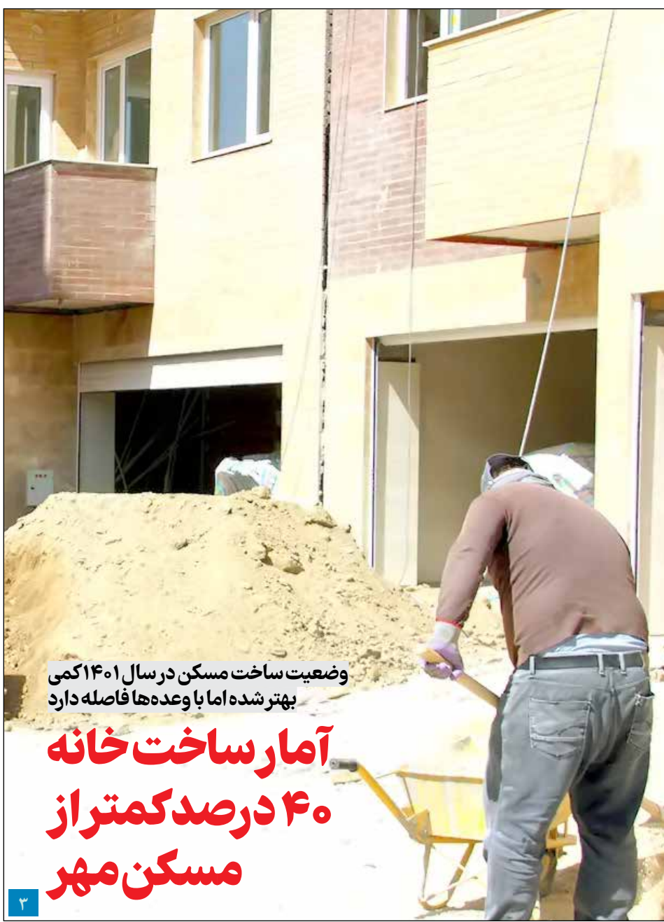
وضعیت ساخت مسکن در سال ۱۴۰۱ کمی بهتر شده اما با وعده ها فاصله دارد