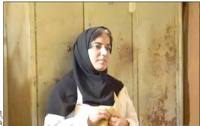
فرانکو با جسیکا چستین و «در

یک فیلمبردار، یوسف صفایی، دستیاران فیلمبردار، حامد محمدی شادان، مهدی حدادی و محمد جواد قلیچ، استدی کی، شاهین شیرزادی، مدیر و طراح صحنه، رضا محمدپور، دستیاران صحنه، ابراهیم مشهدی و مهدی علیزاده، طراح لباس، فهیمه تقوی، صابراراحمد محمدی، دستیار صدا، هاشم امینی، طراحی و ترکیب صدا، آرش قاسمی، مدیر فنی استودیو، امیر قاسمی، طراح گرافیک، سراج حاجی آقاچانی، دستیار گریم، ساره پور قریان، حوچه ویژه بصری، مهرا ن جلی، تصحیح رنگ، فرید جلالی، زیرنویس، رضا تاری وردی، مترجم، حسن شرف الدین، آهنگساز: سراج الدین روحانی فرید، میکس و مستر: نوید صالح زاده، نوازنده ویلن: آرش ناصر المعمر، مدیر تدارکات: داوود حسن زاده، دستیار تدارکات: محمد امین مجیدی، مدیر تولید: هام رسولی، جانشین تولید: رضا موسی زاده گلستانی و سهراب سلطانی، گروه تولید: امیرعلی علیپور و امیر حسین امینی یزدی، طراح پوستر و لوگو: متین خییلی، عکاس و تصویربردار پشت صحنه: مهرداد حدادیان، مشاور رسانه‌ای: آزاده فضلی، تهیه‌کننده: فریا عرب (کمپانی CHOSEN IMAGE)، پخش بین‌الملل: مجتبی عبدالرحیم خان و مهدی مهانی.