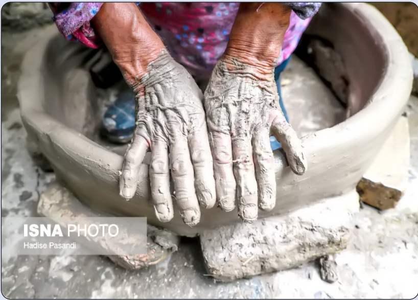
ISNA PHOTO Hadise Pasand