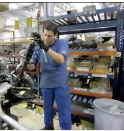
گزارش اقتصاد آنلاین

اقتصاد ایران در تیر ماه، در مزر رکود و رونق قرار گرفت بر این اساس، شاخص اقتصاد ایران در اولین ماه تابستان عدد ۶۳-۵۰ هادو ثبت شد که این عدد حاکی از کاهش ۶۵ واحدی نسبت به ماه گذشته است. در ماهی که گذشت، مدیران اقتصادی مهم‌ترین مشکلات مسائل گمرکی، مشکل تأمین سرمایه در گردش، مسائل مربوط به تعهد ارزی، تعیین واحد مالیات‌ها با معیارهای غیر کارشناسی عدم ارائه تسهیلات از سوی بانک‌ها، مشکلات ناشی از اداره امور مالیاتی، موانع ایجاد شده از سوی بانک مرکزی، موانع ایجاد شده از سوی وزارت صمت، قطعی برق و... عنوان کردند. بر اساس اطلاعات شاخص تیرماه، روند کاهش شاخص اقتصاد در تیرماه ادامه پیدا کرده و بنگاه‌های موجودی مواد اولیه و میزان فروش کالا و خدمات در مقایسه با خرده‌ماه اقدام گسترده‌ای ثبت کرده‌اند. در بخش صنعت نیز شاخص شاخص با وجود قابل توجهی در مقایسه با خرده‌ماه، به کمترین مقدار ۶ ماهه رسیده و بنگاه‌ها ضمن کاهش مستحسوس در موجودی مواد اولیه و میزان فروش کالا، پایین‌ترین میزان خوش‌بینی به بهبود وضعیت تولید در ۱۳ ماه گذشته ثبت کرده‌اند.