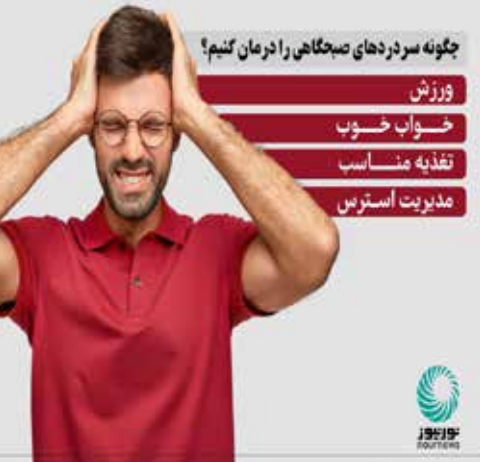
گونه سردردهای صبحگاهی را درمان کنیم؟