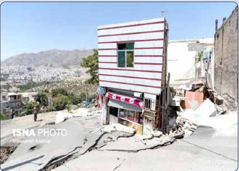
عکاس: معصومه علی اکبر ایسنا

رانش زمین در محدوده ای از اراضی موسوم به تبه الله اکبر منطقه حصار کرج، صبح پنجشنبه ۱۹ مرداد ماه، باعث تخریب و خسارت به تعدادی از واحدهای مسکونی و تجاری این منطقه شد. با توجه به حضور نیروهای آتش نشانی، خدمات شهری، مدیران مربوطه و نمایندگان دیگر دستگاه های امداد و نجات در محل رانش، عواقب احتمالی در حال کنترل است. اقدامات لازم جهت تأمین ایمنی ساکنین پلاک های مجاور در حال انجام است و به منظور اطمینان خاطر از عدم تسری ایجاد حادثه تأسیسات گاز و برق و آب به طور موقت از مدار خارج شده است. عکاس: معصومه علی اکبر ایسنا