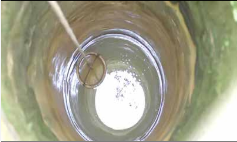
خبر: دنیای اقتصاد

ولایتی ترین خط انتقال بساب به صنعت به طول ۱۰۰ کیلومتر با استفاده از توان بخش خصوصی با مبلغ هزار میلیارد ریال در یزد، آغاز عملیات آگیری است. سخنانی کهیر شهرستان کنارک در استان سیستان و بلوچستان با ظرفیت ۳۴۵ میلیون متر مکعب، بهره برداری از شبکه های پایاب سد آبدوغوش، سیند و صومعه کیودین در استان آذربایجان شرقی قطع آب رسانی به ۱۸۴۰ هکتار از اراضی کشاورزی احصا شده اند.