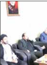
تصمیم داریم ادارات شهرستانی را قوی‌تر سازیم تا در چرخه توسعه منطقه کنیم.