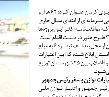
معاونت بهبود تولیدات دامی جهاد کشاورزی جنوب