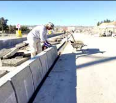
معاونت بهبود تولیدات دامی جهاد کشاورزی جنوب

نماینده مردم کرمان و راور در مجلس با اشاره به سهم پایین استان کرمان در صادرات خدمات و محصولات دانش‌بنیان، بر لزوم برنامه‌ریزی برای بهبود این حوزه تأکید کرد. دکتر محمدمهدی زاهدی با گرامیداشت روز صادرات با اشاره به جنگ اقتصادی و تحریم‌های ظالمانه باهدف متزلزل کردن اقتصاد کشور، اظهار کرد: اگرچه این تحریم‌ها به معیشت خانواده‌ها تأثیر داشته، اما در اراده و همرامی ملت ایران در مسیر پیشرفت بی‌اثر بوده است. او صنایع فولاد و مس و محصولات پسته، خرما، مرکبات و صنایع دستی همچون فرش، گلیم و پته را به‌عنوان مهم‌ترین اقلام صادراتی استان کرمان دانست که سهم قابل توجهی در حوزه صادرات غیر نفتی داشته‌اند. عضو کمیسیون تلفیق برنامه هفتم توسعه، راه‌اندازی در گاه ملی مجوزهای کسب و کار و تأکید دولت بر استقرار کامل پنجره ملی خدمات دولت هوشمند را از اقدامات ماندگار دولت سیزدهم دانست که موجب تسهیل صدور مجوزها و ایجاد شفافیت و حذف رانت می‌شود.