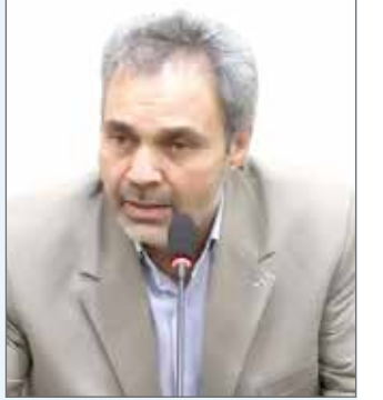
راه روستایی در شرق استان کرمان حادثه آفرید