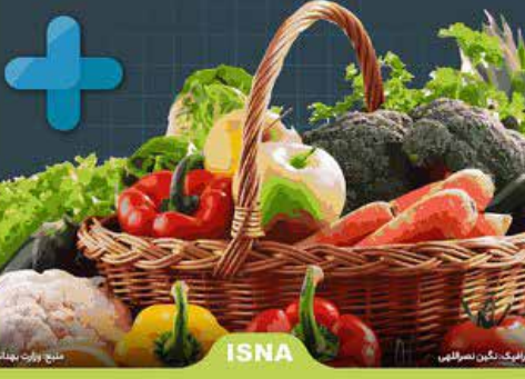
گروه: نگین سرفرازی / منبع: روزبه بهشت