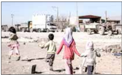
این مسئول همچنین اظهار داشت: در بحث حمایت کودکان کار از محل منابع سازمان اجتماعی کشور شهرستان بم را به‌صورت ویژه خواهیم دید. او افزود:

اگرچه بسیاری از کودکان کار را اتباع خارجی تشکیل می‌دهند، اما این داستان با هم غم‌انگیز است. این امر خود به‌عنوان یک معضل و آسیب اجتماعی تلقی می‌شود. حجت‌الاسلام ملکی ادامه داد: تاکنون در حوزه اتباع خارجی دستگاه‌های مختلفی فعالیت داشته‌اند؛ اما عدم هماهنگی وجود داشت و اکنون تمرکز روی سازمان ملی مهاجرت شکل گرفته است. رئیس کارگروه کودکان کار و خیابان شورای اجتماعی وزارت کشور گفت: در این سفر گزارشی از ظرفیت‌ها و مشکلاتی که در حوزه کودکان کار وجود دارد ارائه شد و امیدواریم به‌زودی در زمینه کنترل و پیشگیری از آسیب اجتماعی کودکان کار در این شهرستان اتفاقات مبارکی رخ دهد.