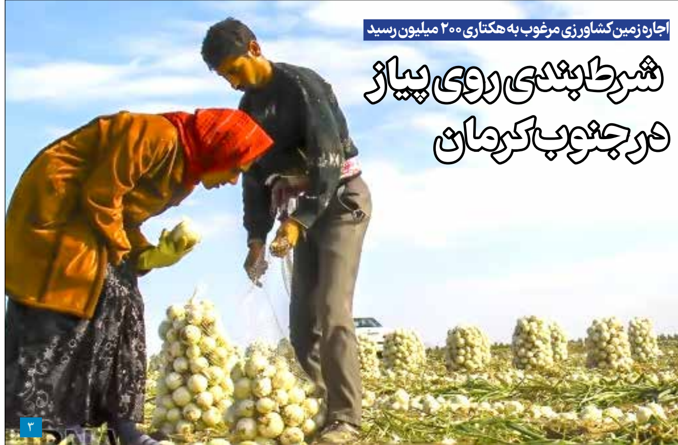
اجاره زمین کشاورزی مرغوب به هکتاری ۲۰۰ میلیون رسید

رئیس پلیس راه جنوب استان کرمان: سه شهرستان در جنوب استان کرمان فاقد دوربین ثبت تخلفات است