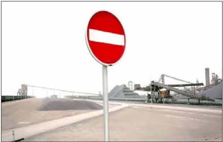
این شاخص در شهریور ماه امسال ۲۴.۶ درصد بوده که با کاهش ۰.۹ واحد درصدی در مهرماه سال جاری به ۲۴ درصد رسیده است. بررسی‌های این گزارش حاکی از آن است که روند رشد نقطه‌ای این شاخص از بهار سال ۱۴۰۰ سیر نزولی به خود گرفته و همچنان سیر نزولی خود را ادامه می‌دهد.

می‌شود. البته در بازار داخل خبری از این ارزان را فروشی‌ها و فراوانی نیست طوری که هر کپسول گاز مایع در برخی موارد قیمتش به ۲۰۰ هزار تومان هم می‌رسد. شرکت پخش و پالایش که عرضه آل پی جی را سهمیه بندی کرده، می‌گوید قیمت مصوب کپسول‌های آل پی جی ۲۷ هزار تومان است، اما آنگونه که دادرسی انجمن جایگاه‌داران سسی آن جی می‌گوید: قیمت یک محصول همانی است که در بازار فروخته می‌شود نه آنچه که از طرف دولت تعیین شده است. در آل پی جی هم قیمت واقعی آن ۱۵۰ تا ۲۰۰ هزار تومان است او که قیمت‌های نجومی حاکم بر بازار را حاصل عرضه‌اندک این محصول می‌داند، گفت: چرا باید محصولی که تولیدات کشور بالا بوده و صادراتی هم صورت نمی‌گیرد چنین بازار سیاهی شکل گرفته باشد. اگرچه جلیل‌سالاری ادعای فعالین انرژی را قبول