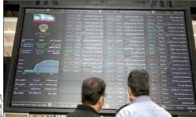
تعداد، اعتماد سهامداران خرد و صاحبان سرمایه‌های کوچک‌تر جلب نشده و مقاطع مثبت بازار، تنها به‌عنوان فرصت خروج پول قوی وارد بازار نشود و معاملات را حرکت

روز گذشته ۷۰ درصد نمادهای بازار سهام در محدوده سرخ‌رنگ قرار گرفتند و تمامی شاخص‌های بازار منفی شدند. ضمن آنکه تراز پول حقیقی منفی و بیش از ۳۲۹ میلیارد تومان پول خارج شد. به گزارش تجارت‌نیوز، روز سه‌شنبه بورس تهران در مسیری متفاوت از روزهای گذشته حرکت کرد و منفی شد. شاخص کل بورس ۹ هزار و ۷۸۴ واحد پایین رفت و با افت ۰.۴۸ درصدی در پله دو میلیون و ۴۶ هزار و ۱۷۵ واحد قرار گرفت. شاخص هم‌وزن نیز که روزهای گذشته تصویر را از بهبود معاملات سهام کوچک و متوسط بازار ارائه می‌داد، روز سه‌شنبه منفی شد و با افت سه هزار و ۳۳۲ واحدی معادل ۰.۴۷ درصد پایین رفت تا در سطح ۷۰۲ هزار ۲۸۷ واحد قرار گیرد. روز گذشته ز در ادامه کاهش ارتفاع نامرگ‌ها،