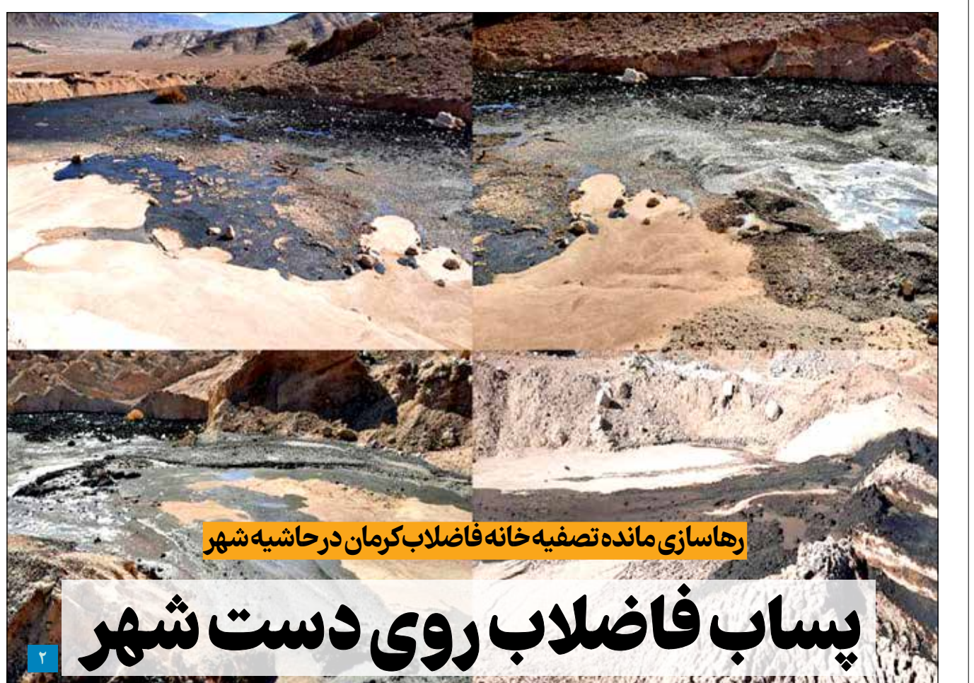
رها سازی مانده تصفیه خانه فاضلاب کرمان در حاشیه شهر

مروجی، رئیس سازمان صمت جنوب: ملی مس هیچ سرمایه گذاری در جنوب نکرده