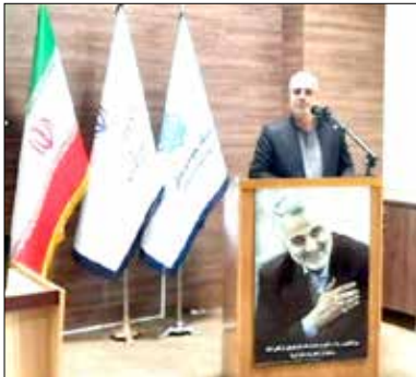
معمطم انقلاب توجه شود. به گزارش ایرنا رئیس دفتر نهاد نمایندگی مقام معظم