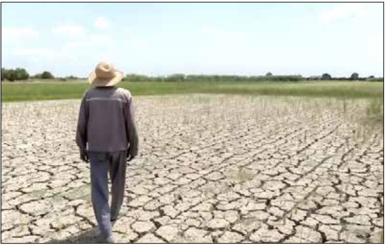
مرکز پژوهش‌های مجلس گزارش داد: احکام این برنامه متناسب با چالش‌های اساسی بخش کشاورزی نیست.

انتهای زنجیره تولید». در راستای بهبود اثربخشی و پیشگیری از بروز عواقب نامطلوب احتمالی اجرای آنها، در لایحه درج شود. ضمن اینکه وضع تکالیفی همچون «واگذاری هماهنگی و سیاست‌گذاری در زمینه منابع طبیعی و آبخیزداری به شورای عالی آب»، «وضع عوارض صادراتی و فراهم کردن زمینه واردات محصولات کشاورزی آب‌بر توسط وزارت نیرو» و «تعیین برنامه الگوی مصرف آب کشاورزی توسط وزارت نیرو»، اختلال جدی در مدیریت منابع آب در بخش کشاورزی و منابع طبیعی ایجاد خواهد کرد. در مجموع می‌توان نتیجه گرفت که احکام مرتبط با بخش کشاورزی و منابع طبیعی در لایحه برنامه هفتم توسعه از قابلیت لازم برای تحقق امنیت غذایی و ارتقای تولید محصولات