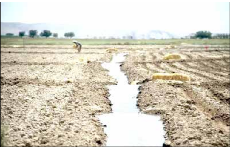
حکام این برنامه متناسب با چالش‌های اساسی بخش کشاورزی نیست.

نگاه سطحی به مقوله بسیار پراهمیت امنیت غذایی در فصل هفتم لایحه، منجر به ارائه برخی از احکام مبهم و درعین حال آسیب‌زا شده است. مرکز پژوهش‌های مجلس این گزارش‌ها را دره‌بندی کرده است: «استفاده از واژه «خودکفایی» به‌جای «خودکفایی»، بر خلاف تأکیدهای فراوان اسناد بالادستی و سیاست‌های کلی برنامه به تحقق خودکفایی در محصولات راهبردی؛ محدودسازی حمایت‌ها به محصولات اساسی و منتخب، آن هم در صورت رعایت الگوی بهینه تولید و بدون اشاره به الزامات پیاده‌سازی این الگو؛ محدودسازی حمایت‌ها به محصولات نهایی و ایجاد مخاطره در روند تولید محصولات کشاورزی، با انتقال تدریجی